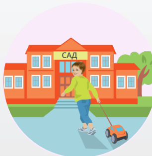
Заведующий детским садом