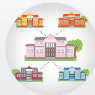
Руководитель образовательного комплекса

Руководители и специалисты департаментов и управлений образованием